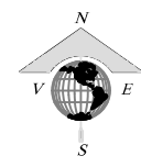
Puncte pe contur imobil